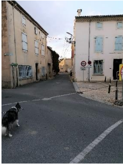
Boulevard du jeu de mail