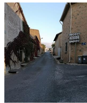
Rue de Belleville