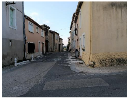
Avenue de la Garrigue