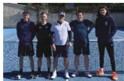
Equipe 2 3ème de poule