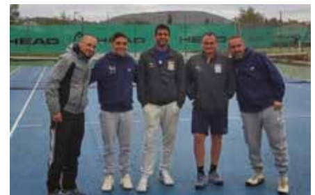
Equipe 1 Messieurs qualifiée en 1/4 de finale