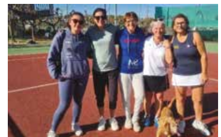
Entente avec Boujan s/Libron

Contacts TC Bassan - Tél : 04 67 48 60 39 E-mail : tcbassan@laposte.net Ecole de Tennis Renseignements et contact : 06 10 91 42 26 Facebook : Tennis club de Bassan