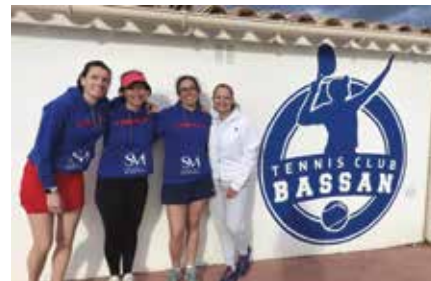
1 équipe Dames 2ème de poule

Les compétitions continueront en début d'année 2024, avec en particulier les coupes + 35 ans.